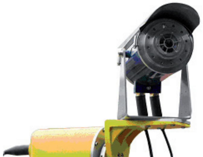
Ex|CAM AF Pro met pan/tilt unit

Alarmcontacten zijn ook voorhanden voor directe integratie met SCADA, DSC of PLC systemen. Dit maakt het mogelijk om geheel geautomatiseerd alarmacties te genereren en/of een installatiestop te initiëren.